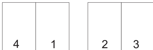
Seitenanordnung für ein 4-seitiges DVD-Booklet